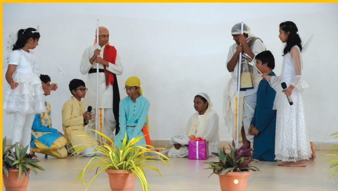
The light of the world shone brightly that holy night.

Jubilee Hills Public School, Rampally, embraced the festive spirit with a grand Christmas celebration filled with joy and creativity on the 24th of December, 2024. The program began with soulful carol singing, followed by an enchanting nativity play that brought the story of Christmas to life. The Principal delivered an inspiring message on the significance of love, unity, and generosity, urging everyone to carry these values forward. Students dazzled the audience with energetic dance performances, adding a vibrant touch to the event. Santa Claus' arrival was met with cheers as he distributed sweets and spread joy among the little ones. The students decorated the Christmas tree and the Crib, which lent a festive fervour to the event. The celebrations concluded with a message of goodwill, leaving everyone inspired by the values of love, harmony, and sharing synonymous with Christmas.