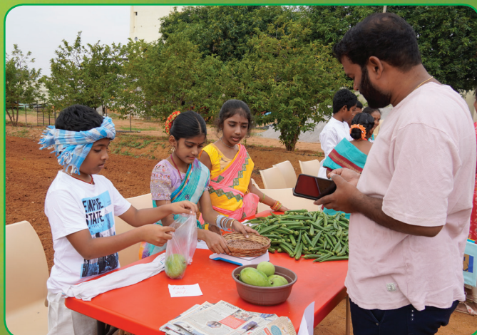
Savour the taste of nature with every bite of our organic veggies.