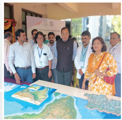
Wonders of 3D Printing in Geography Congress