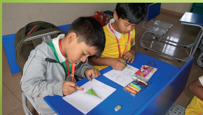
Color, imagination, and talent shine through in this drawing competition