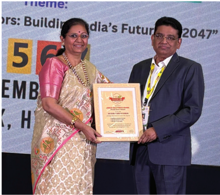
ET TECH X Trailblazer School of the Year Award