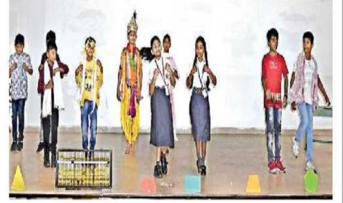
రామానుజన్ విజయాలపై విద్యార్థుల నాటక ప్రదర్శన

కిసర, న్యూస్టుడే: ప్రముఖ గణిత శాస్త్రవేత్త శ్రీనివాస రామానుజన్ జయంతిని పురస్కరించుకుని శనివారం రాంపల్లిదాయరలోని జూబిలీహిల్స్ పబ్లిక్ పాఠశాలలో గణిత దినోత్సవాన్ని నిర్వహించారు. విద్యార్థులు రామానుజన్ జీవిత విశేషాలు, ఆయన సాధించిన విజయాలను నాటకంలో ప్రదర్శించారు.