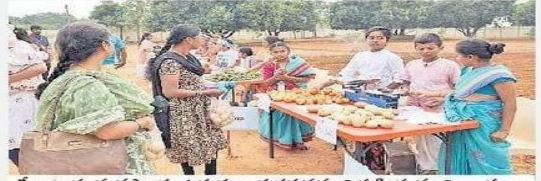
సేంద్రియ వ్యవసాయ ఉత్పత్తుల ప్రదర్శనను నిర్వహిస్తున్న విద్యార్థులు