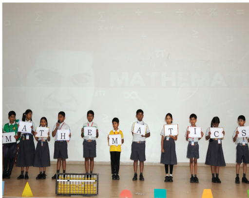
Mathematics Day Celebrations