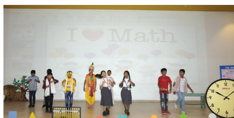
Mathematics Day Celebrations