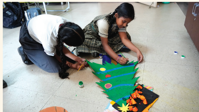
Merry and bright, with a dash of creative light