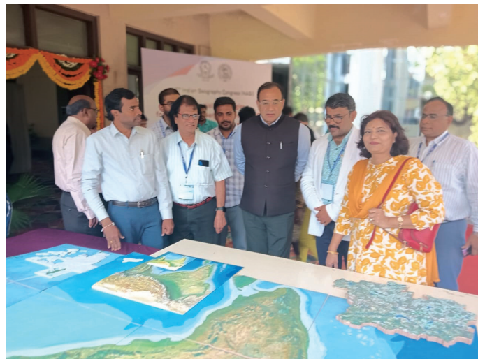
Displaying the 3-D Model of India Created in JHPS, Rampally

The 46th Indian Geography Congress 2024, was held at Osmania University, Hyderabad where distinguished geographers from institutions like NRSC, NGRI, GSI from all over India participated. The event provided a platform to showcase the skill and knowledge of JHPS-R by displaying the one of its kind 3D printed model of Physical Features Map of India. This work received appreciation and positive feedback and kindled the passion for Geography. The importance of 3D models in Geography was widely appreciated by one and all present.