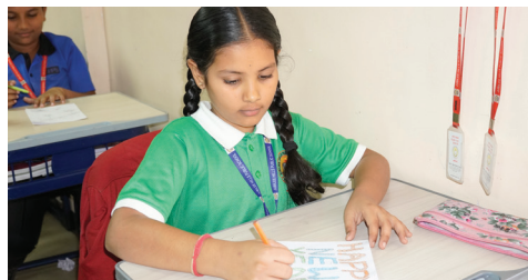
New Year Greeting Cards A Heartfelt House Activity