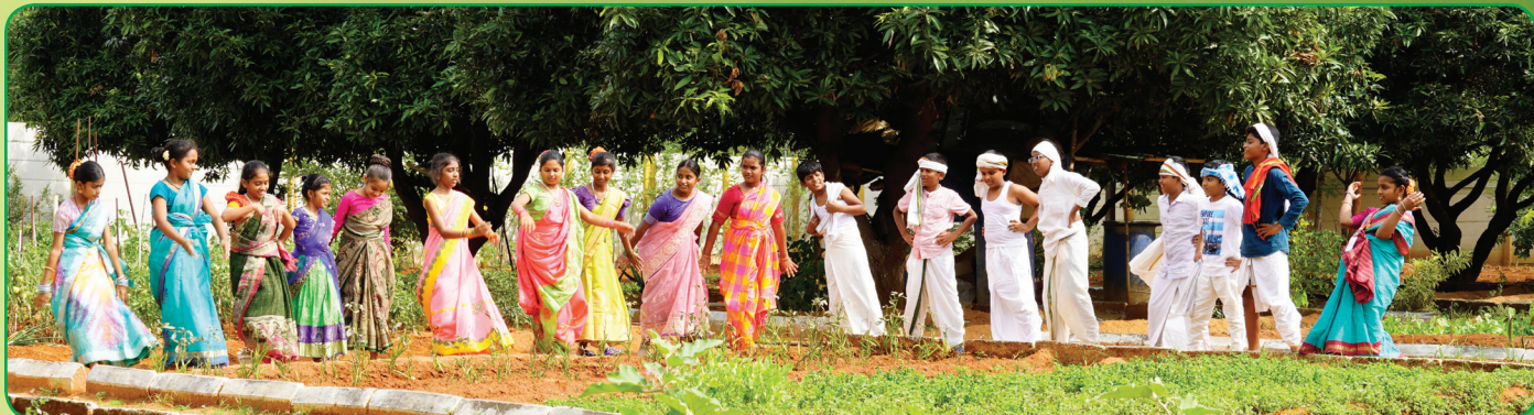
Nature-inspired farms, designed for a greener future.