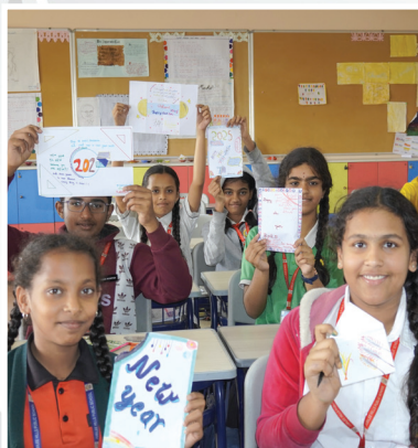
New Year Greeting Cards A Heartfelt House Activity