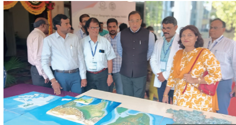
Wonders of 3D Printing in Geography Congress