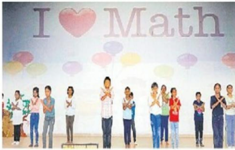
రాంపల్లి జూబిలీహిల్స్ పబ్లిక్ స్కూల్లో గణిత దినోత్సవ కార్యక్రమంలో విద్యార్థులు