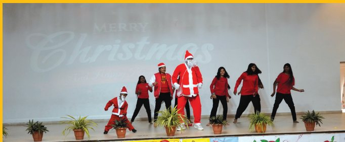
Making memories, one Christmas moment at a time