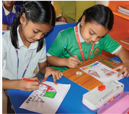
House Activity - Drawing with Shapes