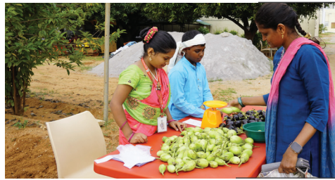
Organic Vegetable Market: Promoting Health and Sustainability