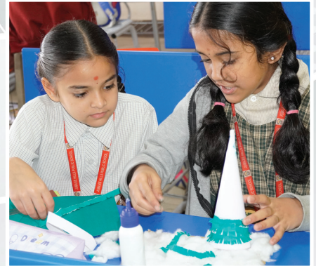
Inter - House Christmas Tree Making Competition

Organic Vegetable Market: Promoting Health and Sustainability