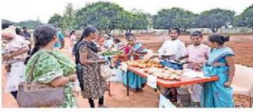
విద్యార్థులతో ఏర్పాటు చేసిన కూరగాయల సంత

కీసర, స్యూస్ టుడే: రాంపల్లిదాయ రలోని జూబ్లీహిల్స్ పబ్లిక్ పాఠశాలలో సోమవారం