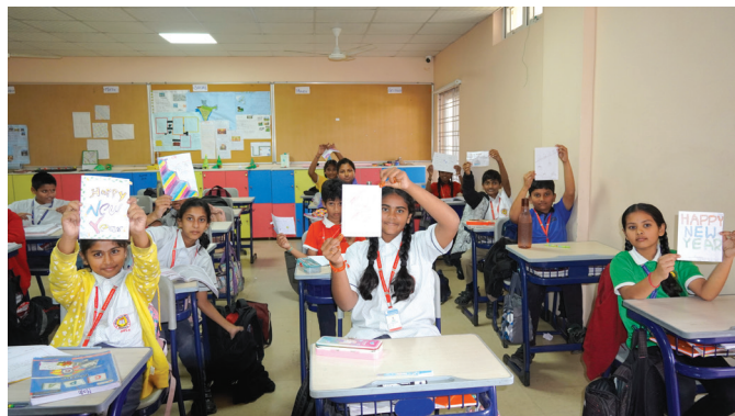
Inspiring smiles through custom creations.