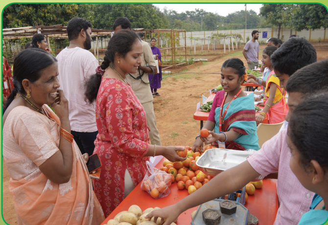
Colourful Produce, Healthy choices. Eating well has never looked this good - Parents Reaction