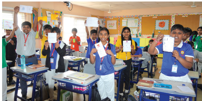
Greeting cards that speak from the heart

Each card was designed with a unique message of hope and joy, which was shared with classmates and staff. The activity fostered a spirit of giving and reflected upon the same theme, allowing students to connect with the school environment in a meaningful way. It was a wonderful opportunity to celebrate the spirit of New Year with kindness and creativity.