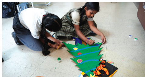
Christmas Tree Making Competition