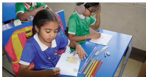
House Activity - Drawing with Shapes