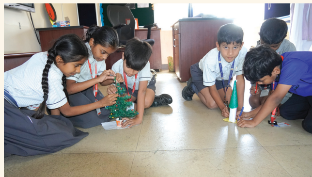
Branching out with creativity! Who's ready to see some festive flair

The Inter-house Christmas Tree Making Competition was held at Jubilee Hills Public School, Rampally on 20th December, 2024. It was aimed to foster teamwork and creativity. Each house was tasked with creating a Christmas Tree using a variety of materials. It created a platform for students to showcase their creativity, cultural appreciation for all the religions and artistic skills.