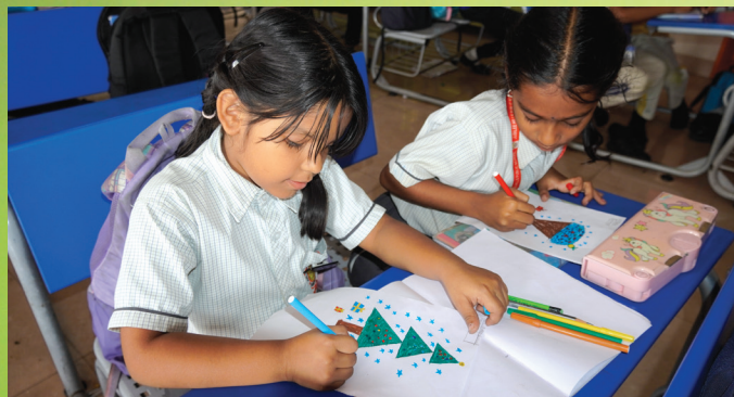
Bringing imagination to life, one stroke at a time

Students of Jubilee Hills Public School, Rampally participated in a creative activity where they drew different shapes as part of their House Activity learning. This engaging exercise helped them develop spatial awareness, improve fine motor skills, and gain a deeper understanding of basic geometric concepts in a fun and interactive way.