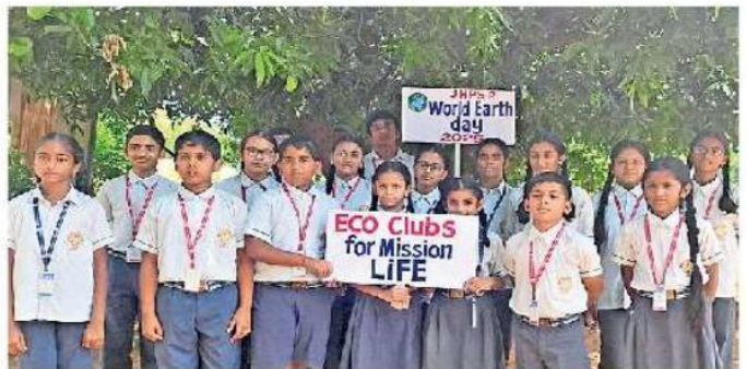
ధరిత్రి రక్షణపై విద్యార్థుల ప్రదర్శన