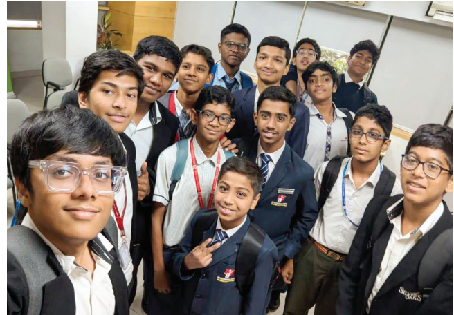
A Trip into the World of Journalism