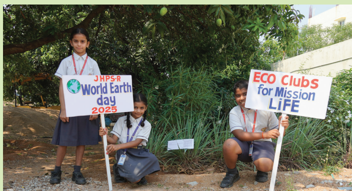
World Earth Day Celebrations

Jubilee Hills Public School, Rampally celebrated World Earth Day 2025 with engaging activities such as creating a record of the flora in the school campus and tagging the trees with a unique QR code.