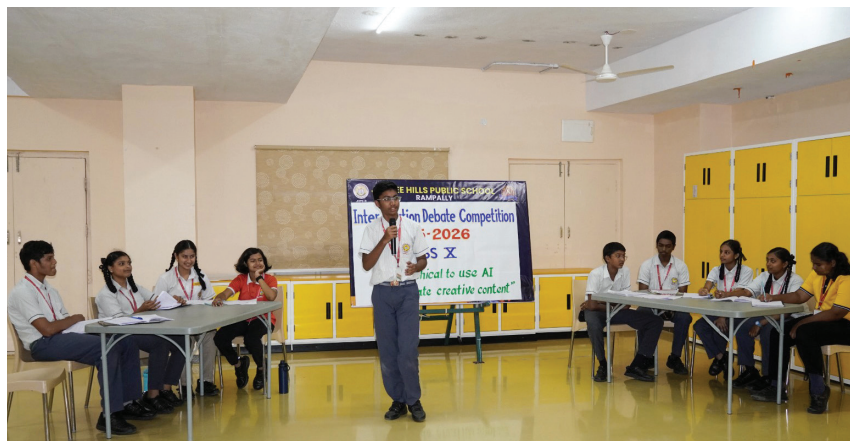
Speak Up, Stand Firm, Debate Well