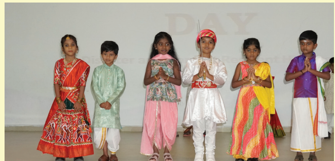
Heritage Walk by Pre-Primary Students