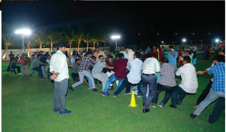
Unforgettable Fun and Memories: Annual Dinner 2025