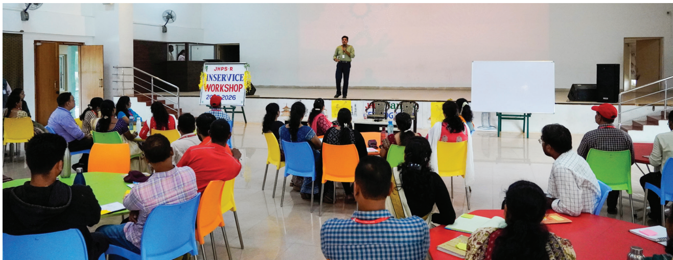
Fuelling The Passion For Teaching

Finally, the workshop emphasized that the substance of teaching—the connection and content—matters more than outward appearances or rigid processes. Overall, the workshop offered a much-needed, practical guide to nurturing teacher well-being and fostering authentic educational experiences.