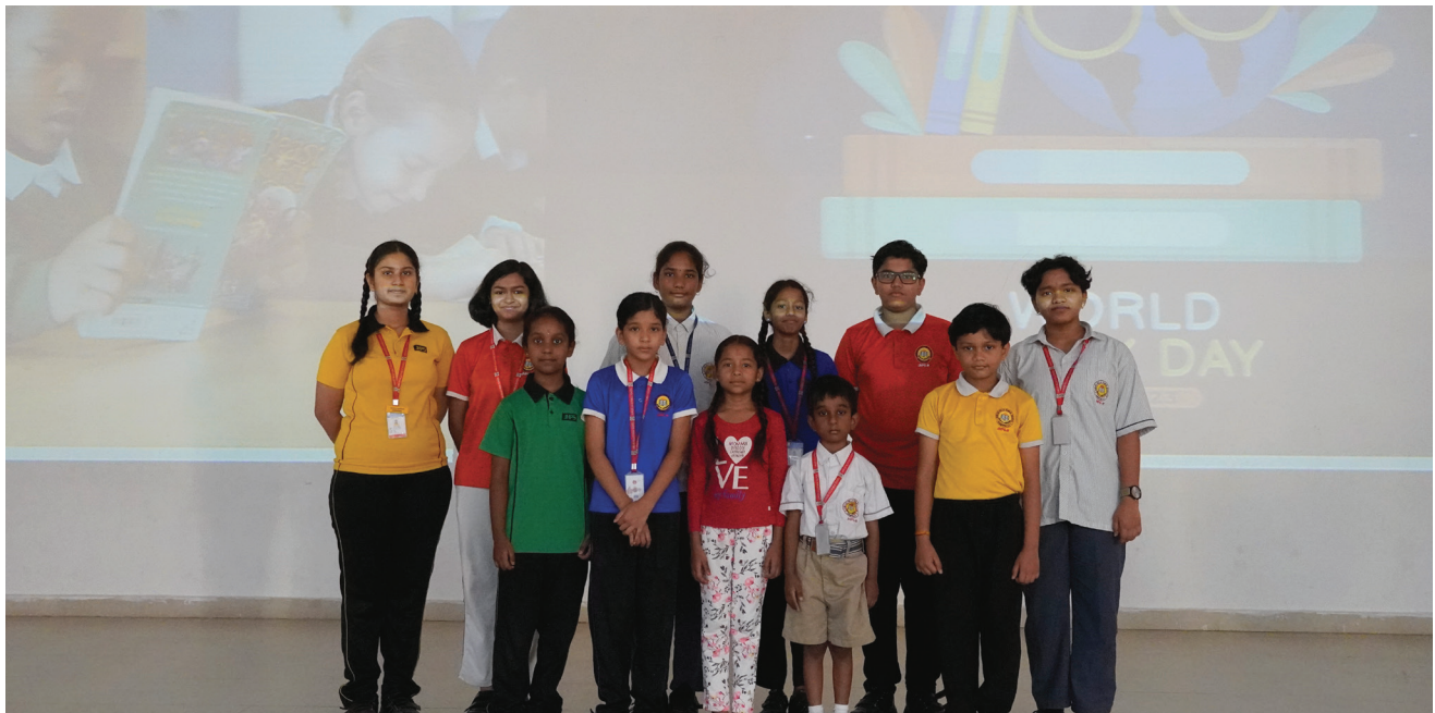
Testing Knowledge, Celebrating Reading