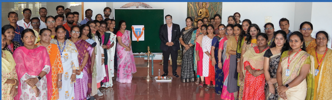
Paying Tribute To The Visionary Dr. K. Kasturirangan.