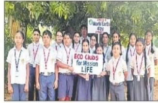
కార్యక్రమంలో పాల్గొన్న విద్యార్థులు