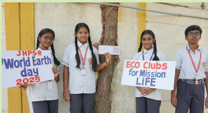
QR –Coded Trees, Eco Lessons Mark Earth Day