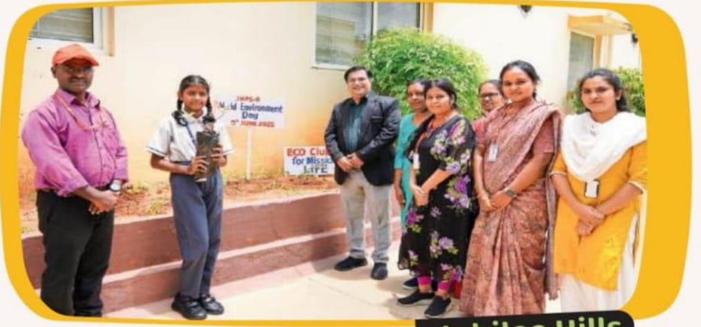
Jubilee Hills PUBLIC SCHOOL, RAMPALLY