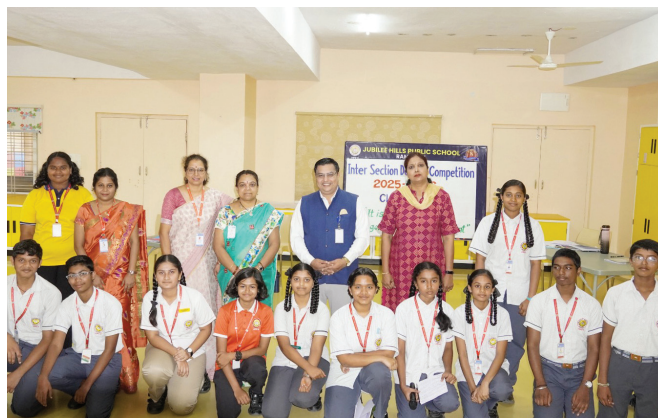
Participants, Judges And Organisers