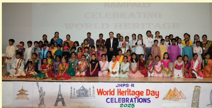
JHPS-R: United in Spirit

Jubilee Hills Public School, Rampally through such initiatives, continues to cultivate informed, empathetic individuals equipped to cherish and protect humanity's shared legacy.