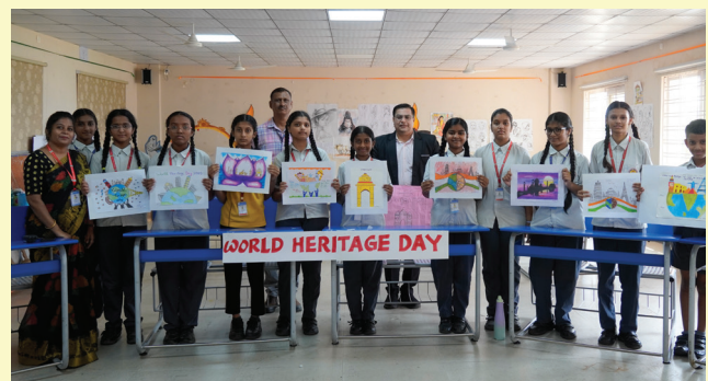
Heritage Art Exhibition By Our Talented Students