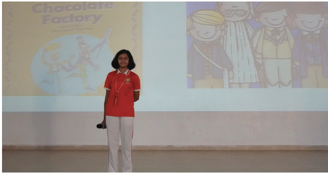
World Book Day: Book Review

This World Book Day celebration at Jubilee Hills Public School, Rampally, was a testament to the institution's commitment to fostering a love for reading and lifelong learning among its students.