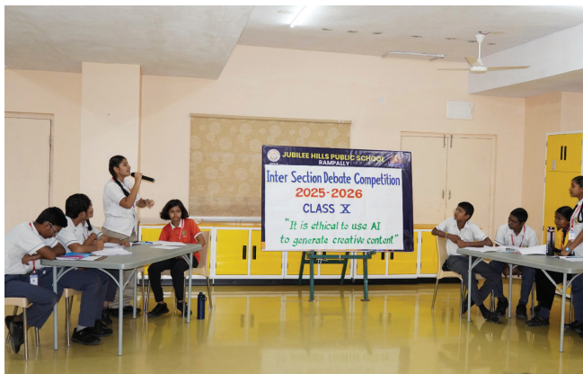
Words Ignite: Arguments Enlighten