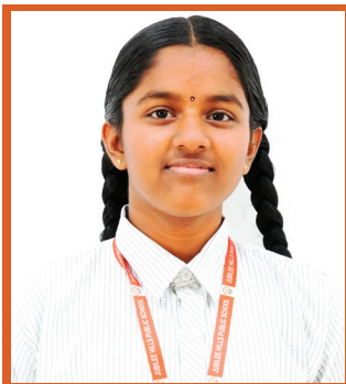
MASARAGANI HANSANANDINI 446/500