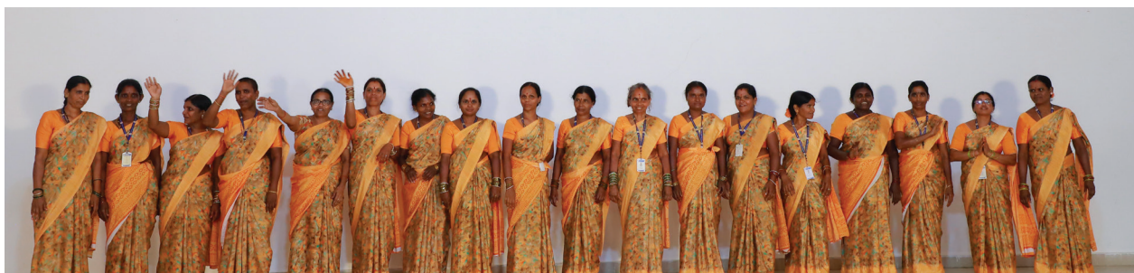
We appreciate you more than words can say - Our Support Staff