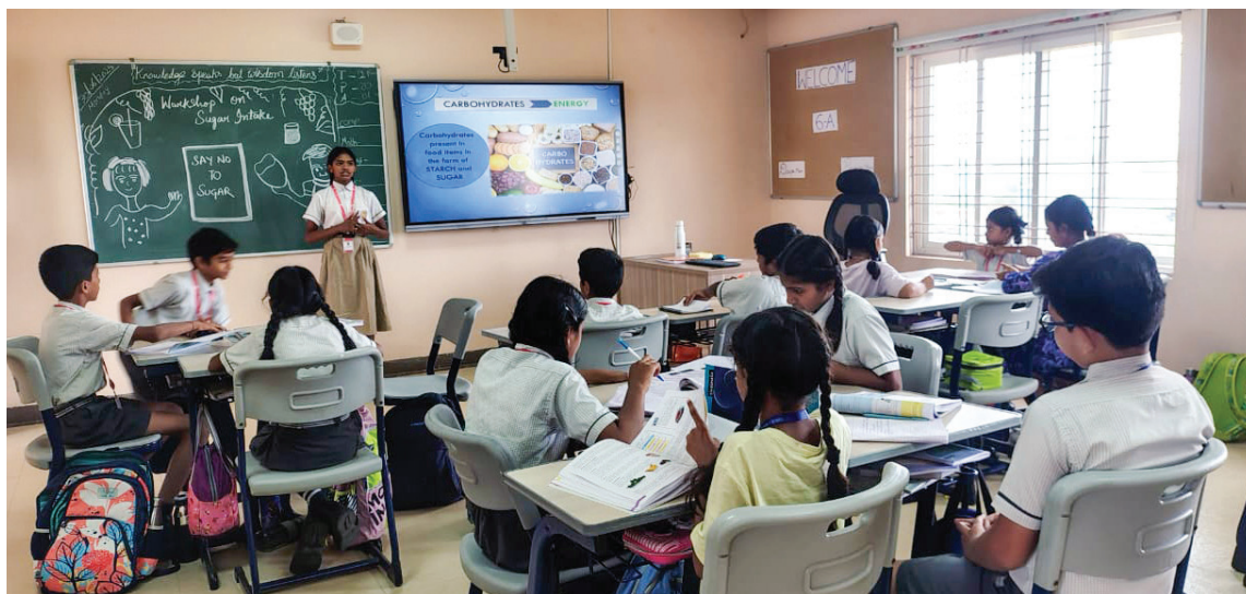
What's In Your Food