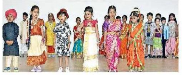
సాంస్కృతిక ప్రదర్శనలో చిన్నారులు