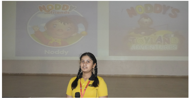
Dive Into Stories: A Journey Through Imagination Reading