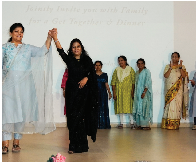
Annual Dinner Vibes