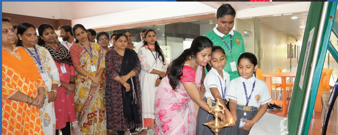
Lighting The Lamp To Honour The Legacy of Dr. K Kasturirangan