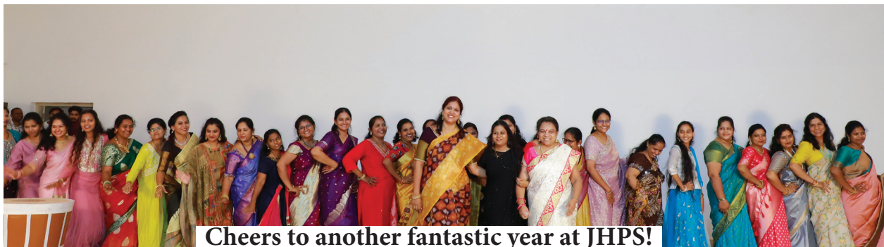
Cheers to another fantastic year at JHPS!