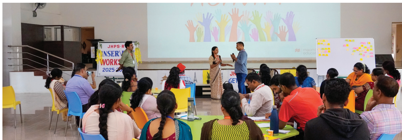
Enhancing Skills & Expending Horizons