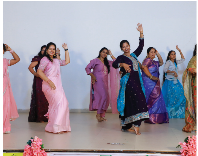
Feel the music...Feel the dance