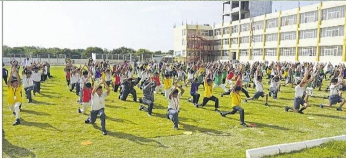
రాంపల్లి జూబిలీహిల్స్ పబ్లిక్ స్కూల్ లో..

మేడ్చల్ జోన్ పరిధిలో ప్రపంచ యోగా దినోత్సవం ఘనంగా జరిగింది. శనివారం పలువురు మాట్లాడుతూ.. యోగ సాధనతోనే మానసిక ప్రశాంతత చేకూరుతుందని వివరించారు. యోగాను ప్రతిరోజూ మన జీవితంలో భాగంగా చేసుకుంటే సంపూర్ణ ఆరోగ్యవంతులుగా తయారవుతామన్నారు.