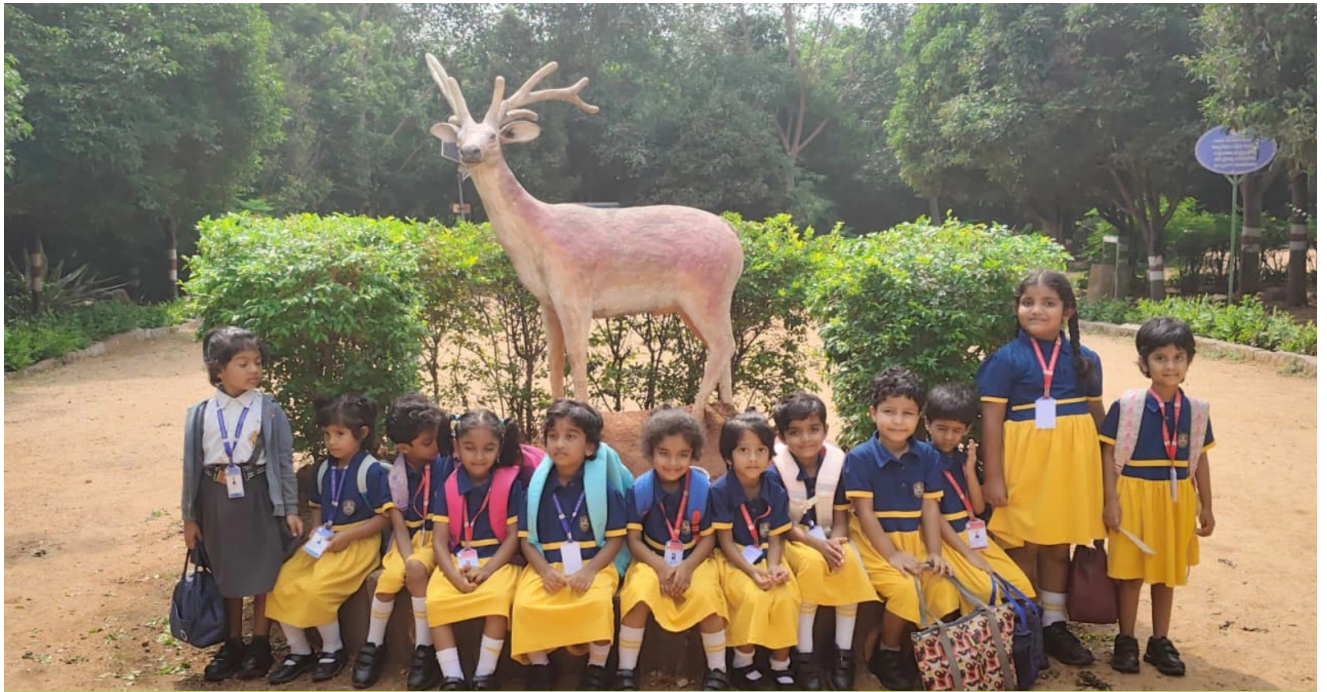
A Day with Nature — Smiles, Sunshine, and Deer Delight!

The students of LKG and UKG of Jubilee Hills Public School, Rampally went on an exciting field trip to Nandavanam Deer Park . The little ones were thrilled to see deer roaming freely amidst lush greenery. Teachers guided them as they learned about animals and the importance of caring for nature. The children enjoyed spotting birds and butterflies, making the day both fun and educational. The trip offered a perfect blend of learning and recreation, leaving the young learners with happy memories and a deeper love for nature.