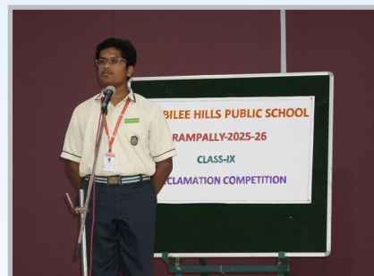
Young Minds, Bold Voices!