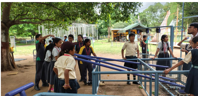
Experimenting, Exploring, and Enjoying!