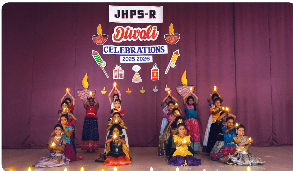
Diwali Vibes at School!

The celebration truly reflected the school's commitment to fostering environmental awareness and value-based learning among students.