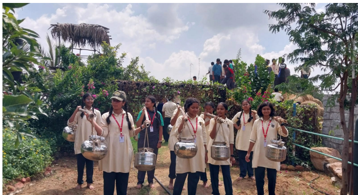
Students Exploring the World of Farming and Rural Innovation!