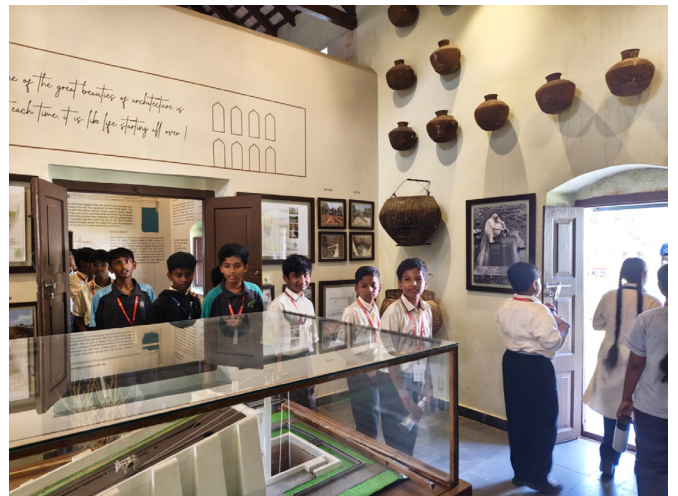
Exploring the Grandeur of Rashtrapati Nilayam!