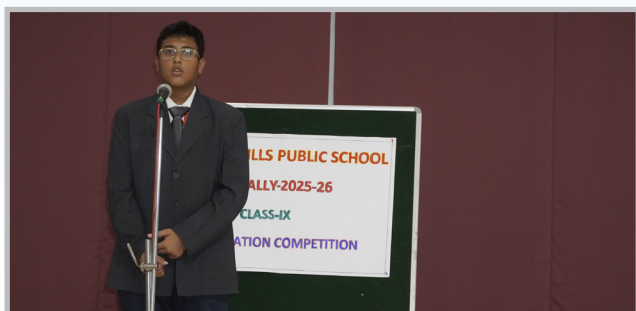
Where Words Made An Impact!