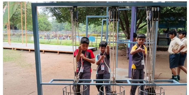
Hands-on Fun at Do-Science Park!