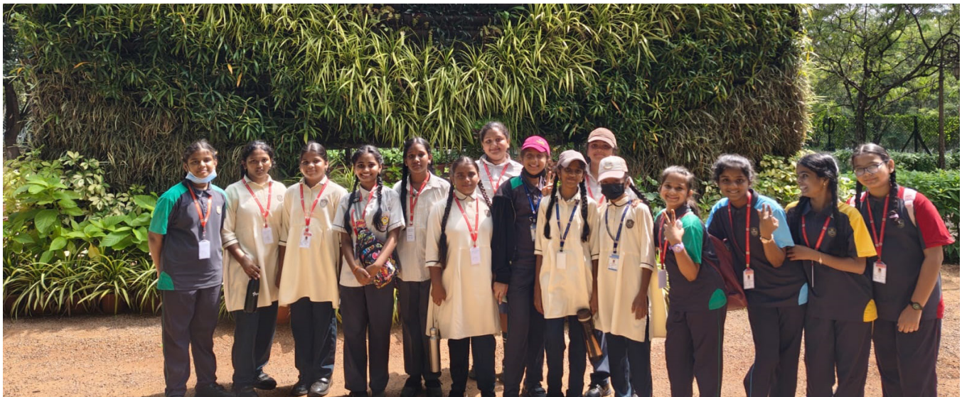
A Day of Learning and Discovery At The Presidential Retreat!