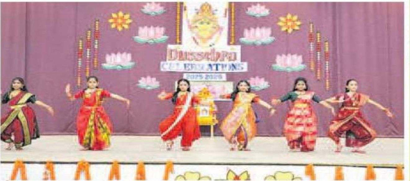
కీసర: జూబ్లీహిల్స్ పబ్లిక్ స్కూల్లో..