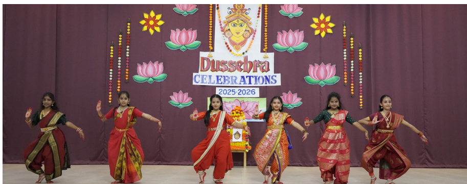
Unity in Celebration, Devotion in Every Performance

In a festive display of great enthusiasm, Jubilee Hills Public School, Rampally, celebrated Dussehra, marking the victory of good over evil. The event started with a devotional song, followed by a speech highlighting the festival's values of truth and courage.