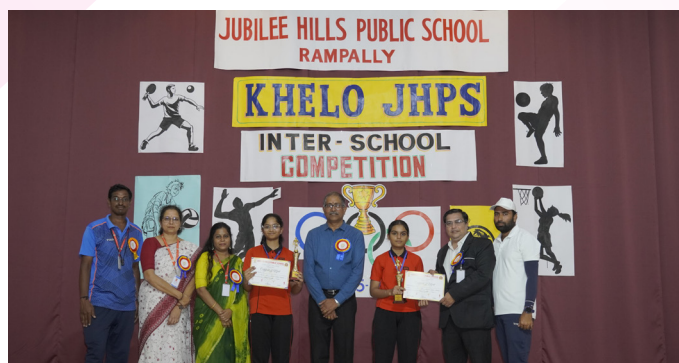
Focus and Precision At the Table Tennis Arena!