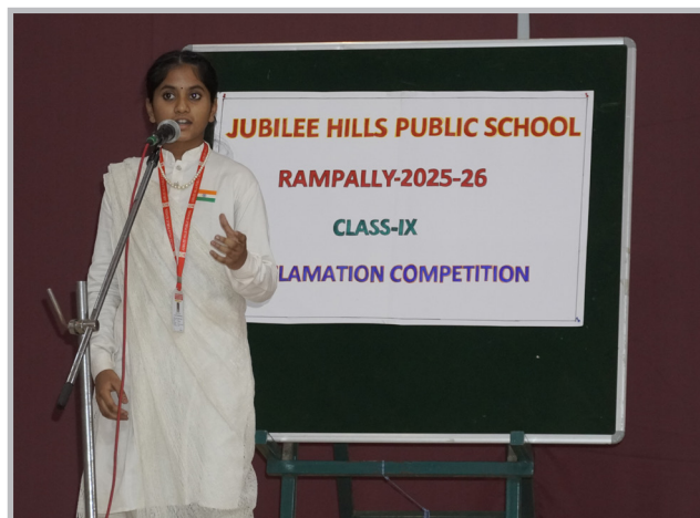
Orators in Action!