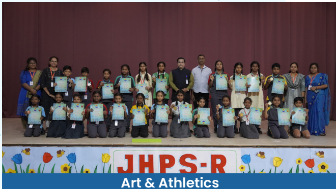
Art & Athletics