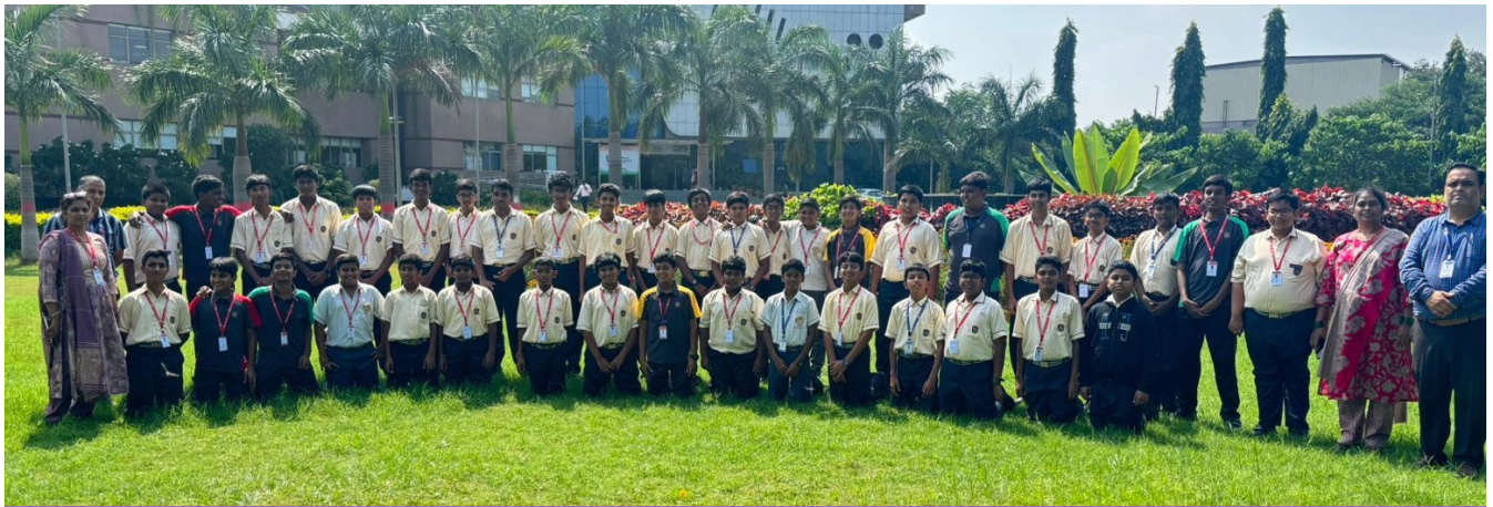
An Insightful Day - Blending Curiosity, Learning, and Innovation!

An informative field trip to the DNA Fingerprinting and Forensic Science Institute in Hyderabad for the students of Class 8 of Jubilee Hills Public School, Rampally. Guided by experts, the students learned about the fascinating world of forensic science and how DNA plays a key role in solving crimes. They observed laboratory equipment and demonstrations on fingerprint analysis and DNA testing. The visit helped them understand the practical applications of science in ensuring justice and safety. Teachers encouraged discussions and questions, making the experience highly engaging. The trip sparked curiosity and inspired many students to explore careers in science and technology in the future.