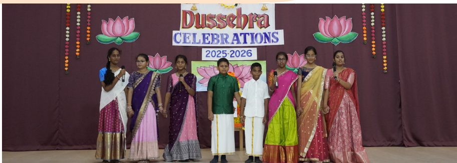
Colours, Culture, and Celebrations Marking Dussehra