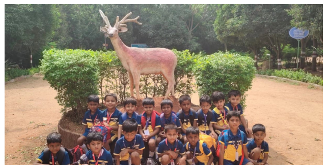
Nature, Friendship, and Endless Giggles!