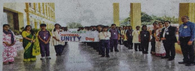
కీసర: రాంపల్లి దాయరలోని జూబ్లీహిల్స్ పబ్లిక్ స్కూల్ లో ఐక్యత పరుగు నిర్వహిస్తున్న విద్యార్థులు