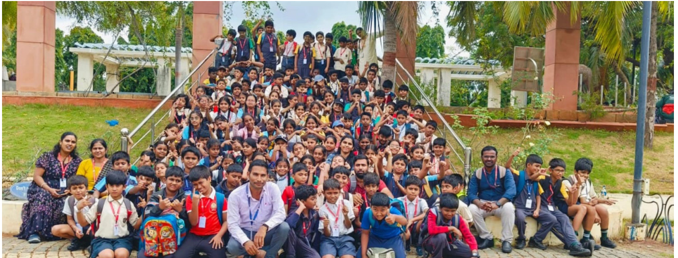
A Day to Wonder, Learn, and Explore!

To encourage experiential learning and spark scientific curiosity, the students of Classes 4 and 5 of Jubilee Hills Public School, Rampally were taken on an educational field trip to Do-Science Park, Hyderabad. It was aimed to provide students with a hands-on understanding of various scientific concepts through interactive exhibits and fun learning activities. The students were fascinated by the vibrant environment of the park, filled with outdoor science models and engaging demonstrations. They explored exhibits on motion, sound, light, and simple machines, which made textbook concepts come alive. The visit not only enhanced their scientific temperament but also nurtured teamwork, observation and curiosity. It was indeed a day filled with learning, laughter and discovery.