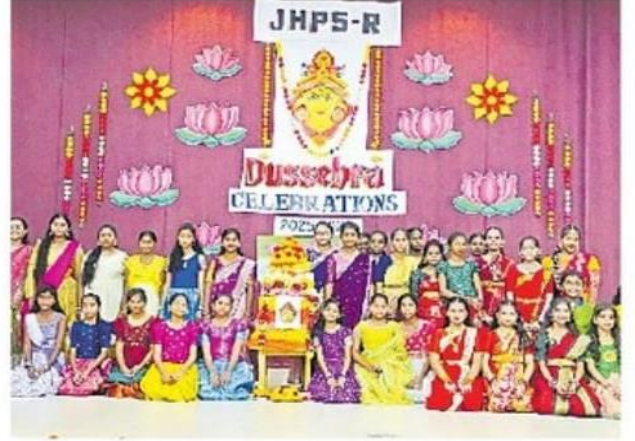
రాంపల్లి జూబ్లీహిల్స్ పబ్లిక్ స్కూల్లో..