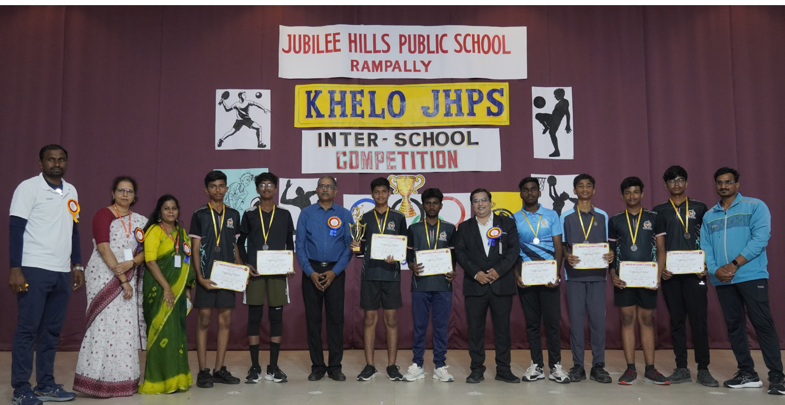
Smashing Serves and Powerful Volleys!