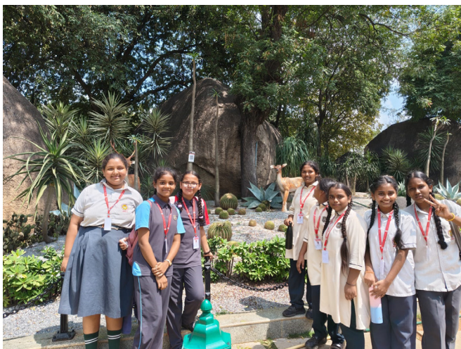
An Enriching Experience - Learning With Exploration!