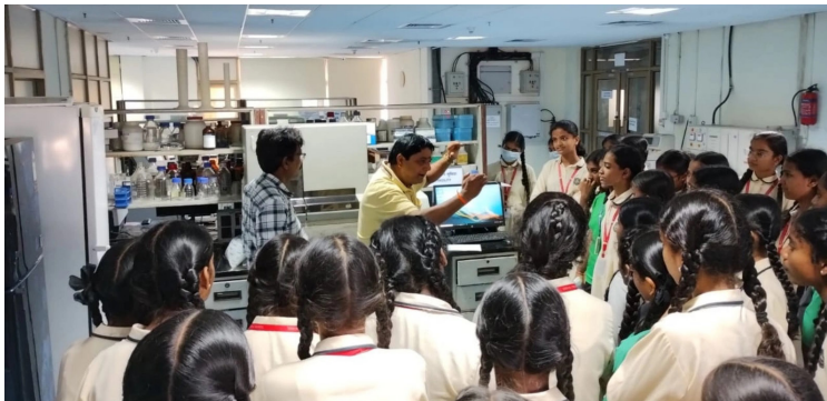
Curious Minds Exploring The World of DNA and Forensics!