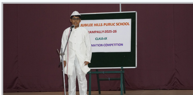
Words that Wowed!