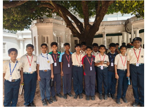
An Educational Trip Filled with Pride and Patriotism!

The students of Classes 6 and 7 of Jubilee Hills Public School, Rampally visited Rashtrapati Nilayam on an enriching field trip that combined learning with exploration. Filled with excitement, they toured the historic residence and admired its majestic architecture, beautiful gardens, and serene surroundings. Teachers explained the significance of the Rashtrapati Nilayam as the official retreat of the President of India during the southern sojourn. The visit gave the students valuable insights into the nation's governance, history and culture. It was a memorable and educational experience that inspired pride and curiosity among the young learners.