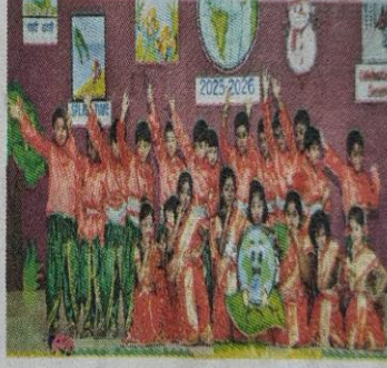
అకట్టుకున్న విద్యార్థుల సాంస్కృతిక ప్రదర్శన