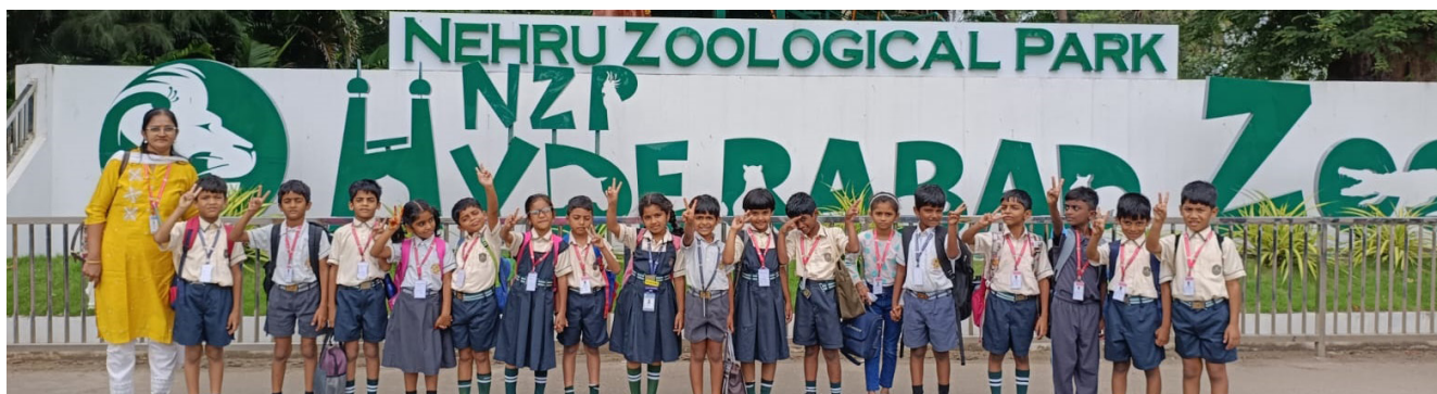
A Fun-filled Day Connecting With Nature and Wildlife!

Jubilee Hills Public School, Rampally organised an exciting field trip to Nehru Zoological Park , Hyderabad for the students of Classes 1, 2, and 3 . Filled with enthusiasm, the children explored the zoo and observed various animals such as lions, tigers, elephants, giraffes and colourful birds. Teachers explained interesting facts about the animals and their habitats, making learning come alive outside the classroom. The trip was both educational and entertaining, helping the young learners appreciate wildlife and the importance of protecting nature.