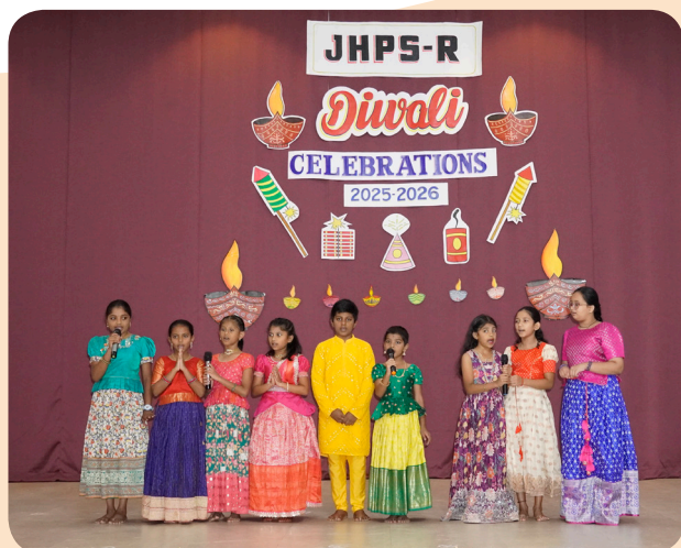
Sparkling Smiles This Diwali!