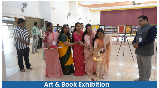
Art & Book Exhibition