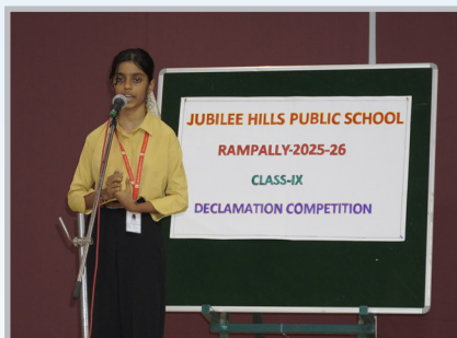
Fearless Voices, Powerful Thoughts!