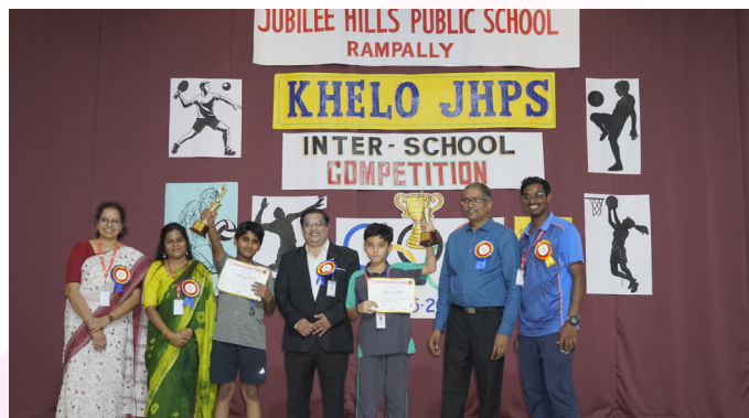
Sweat, Skill and Success On the Field!

Jubilee Hills Public School, Rampally proudly hosted its first-ever Inter-School Sports Meet - Khelo JHPS , marking a significant milestone in its journey of sporting excellence. The event began with a grand opening ceremony and oath-taking, setting the tone for a day filled with enthusiasm and teamwork. Exciting matches of Volleyball and Table Tennis were held, showcasing the skill, energy and sportsmanship of young athletes from various schools. Cheers and applause filled the air as players competed with great spirit and determination. The meet concluded with the Prize Distribution ceremony , recognizing winners and participants alike. The event was a grand success, celebrating unity, discipline and the true spirit of sportsmanship.