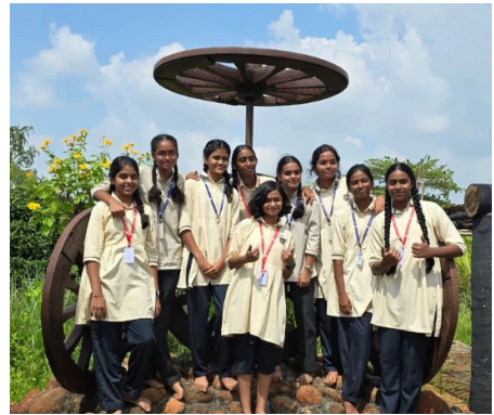
An Enriching Experience - Science, Nature, and Teamwork!

The students of Classes 9 and 10 of Jubilee Hills Public School, Rampally visited One Day Kisan, an innovative agricultural learning centre, for an enriching field trip. The visit offered them first-hand experience of modern farming techniques, organic cultivation, and sustainable agricultural practices. Students interacted with farmers and experts who explained the importance of soil health, irrigation methods and crop rotation. They also witnessed demonstrations of eco-friendly practices used in farming. The trip provided valuable insights into the role of agriculture in our daily lives and inspired students to appreciate the hard work of farmers.