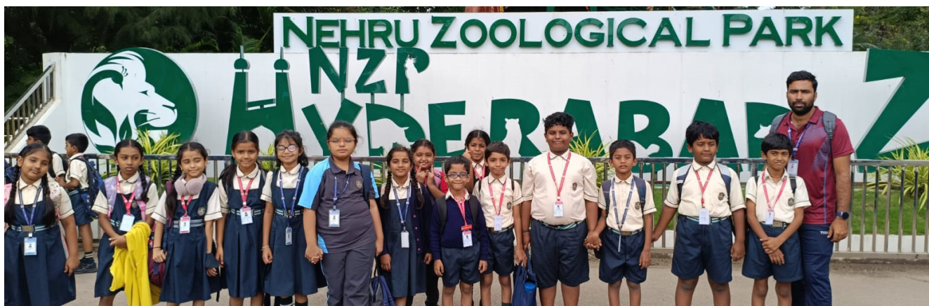
Learning About Animals the Fun Way!