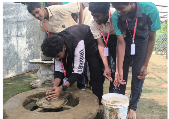
Understanding the Essence of Farm Life!