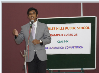
Confidence on the Mic!