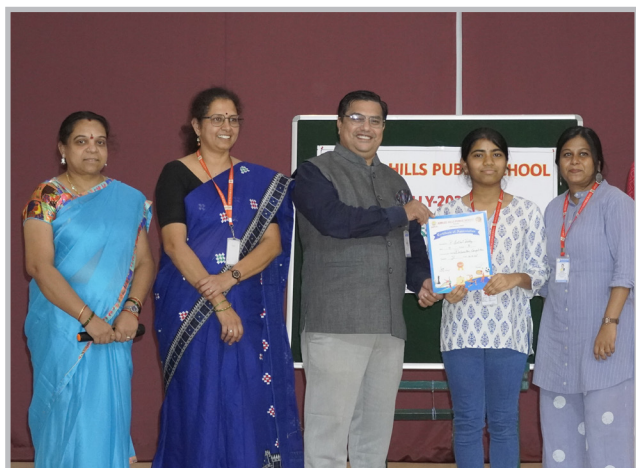
Mic Moments That Mattered!