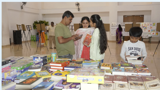
A Celebration of Talent and Imagination!