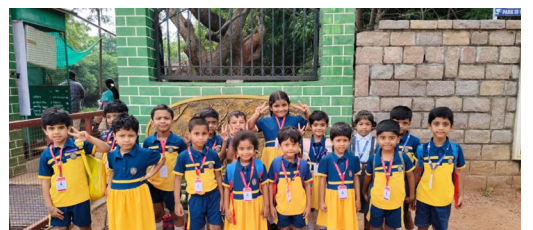
Little Explorers on An Adventure at Deer Park!