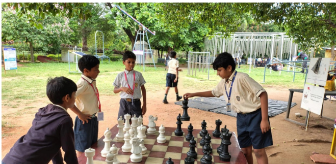
Fun, Facts, and Fascination All Around!