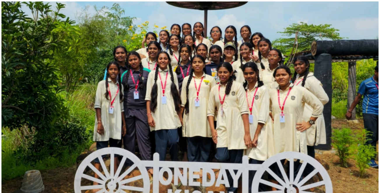
Hands-on Lessons - At One Day Kisan!