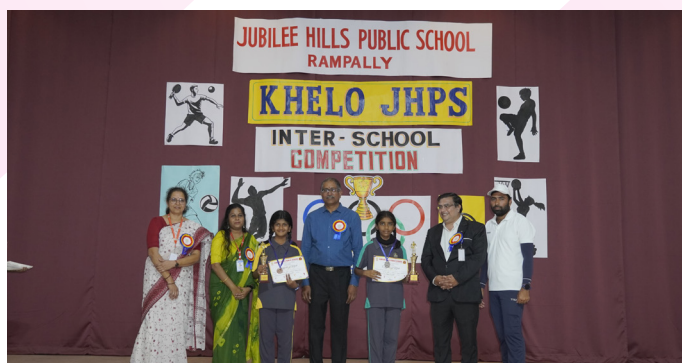
Striving, Competing and Celebrating Together!