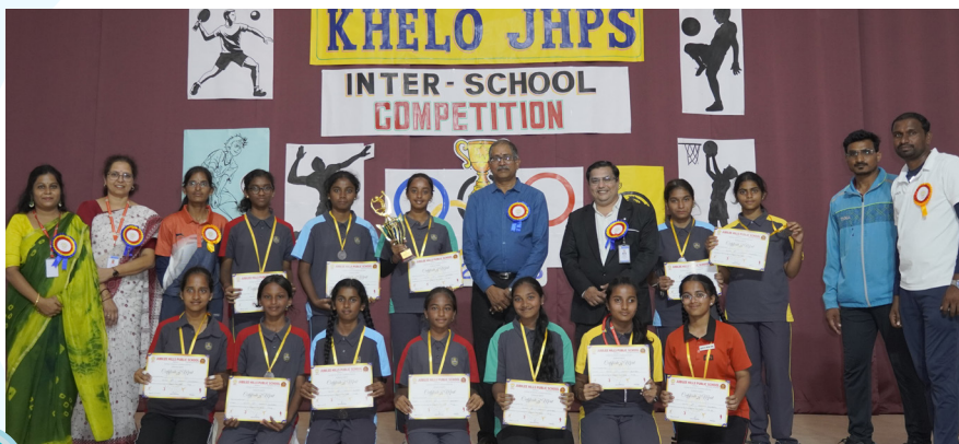
Khelo JHPS: Inter-School Sports Meet