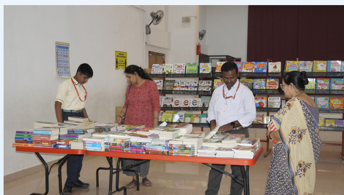
Explore.... Imagine.... Create....