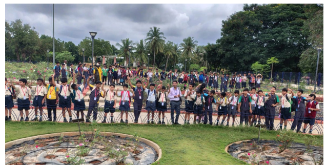
A Day Full of Learning Beyond Classrooms!