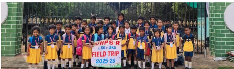
Learning Beyond Classrooms — Our Little Nature Lovers!