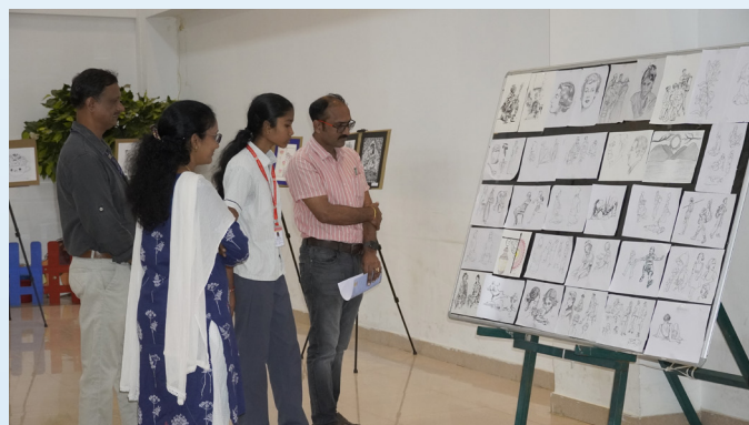
Art That Speaks, Books That Inspire!