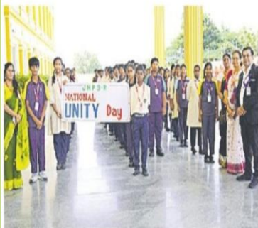
రాంపల్లి జూబ్లీహిల్స్ పబ్లిక్ స్కూల్ లో..

మేడ్చల్ నియోజకవర్గవ్యాప్తంగా సర్దార్ వల్లభాయ్ పటేల్ జయంతి వేడుకలను శుక్రవారం నిర్వహించారు. ఈ సందర్భంగా నాయకులు, ప్రజాప్రతినిధులు, అధికారులు పటేల్ విగ్రహాలు, చిత్రపటాలకు పూలమాలలు వేసి ఘనంగా నివాళులర్పించారు. అలాగే ఏక్టా డివన్ లో భాగంగా రన్ ఫర్ యూనిటీ ర్యాలీలు చేపట్టారు. అనంతరం పలువురు మాట్లాడుతూ.. కులం, మతం, ప్రాంతం భేదాలకతీతంగా దేశ సమైక్యత కోసం పటేల్ ఎంతో శ్రమించారని గుర్తుచేశారు. ఆయన వారపతీనే హైదరాబాద్ సంస్థానం దేశంలో పీఠినం అయ్యిందని పేర్కొన్నారు.