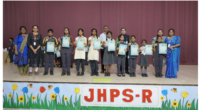
Artistic Expressions -Celebrating the Win!