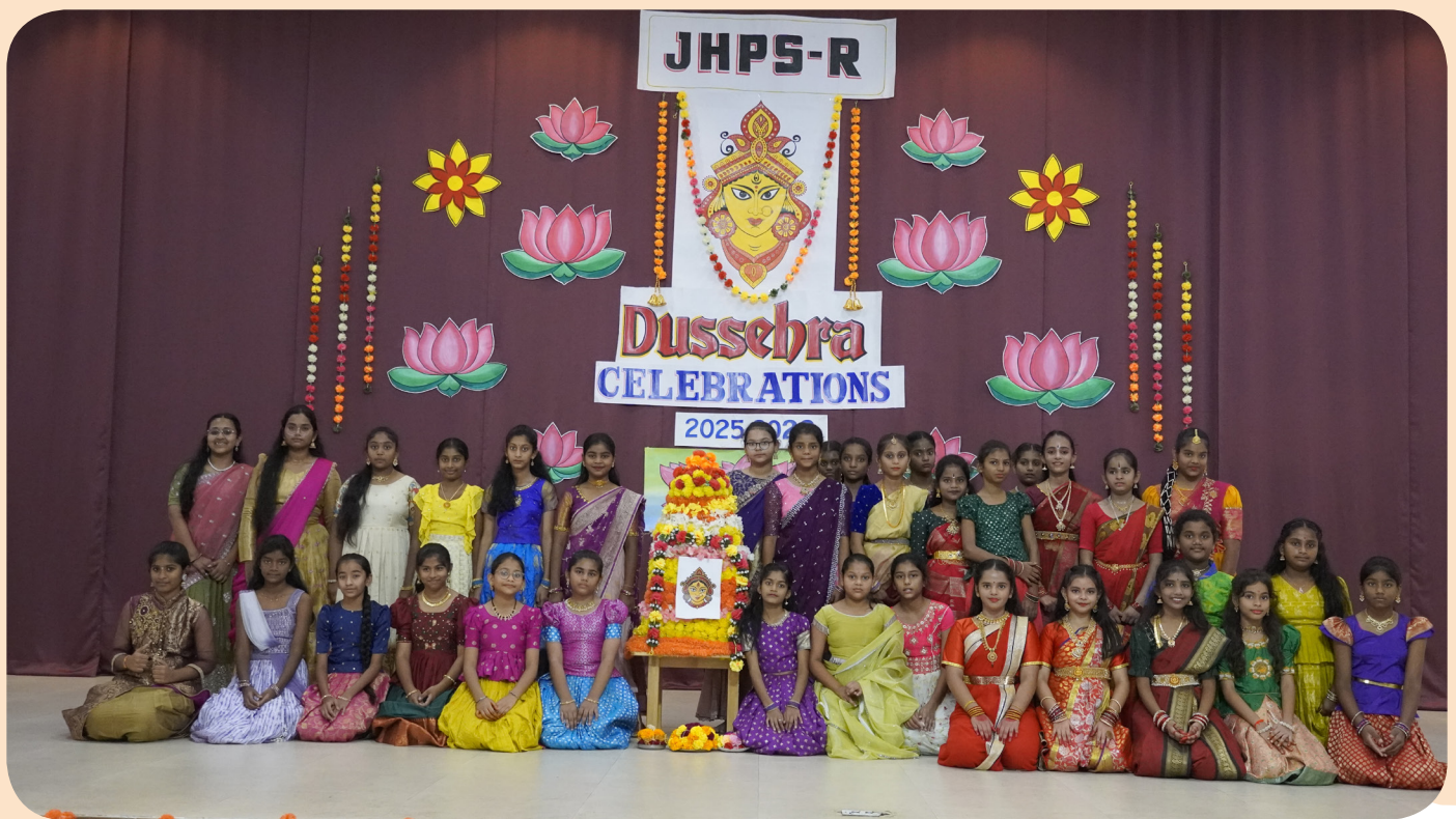
Festivities in the Air – Celebrating the Spirit of Dussehra & Bathukamma