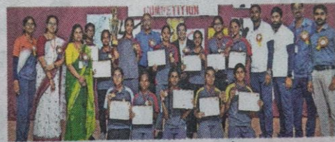
ప్రశంసా పత్రాలతో విజేతలు