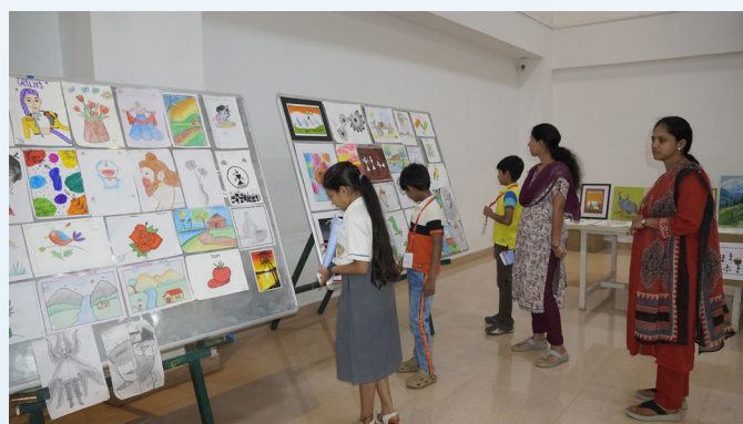
From Pages to Paintings – Creativity Unleashed!