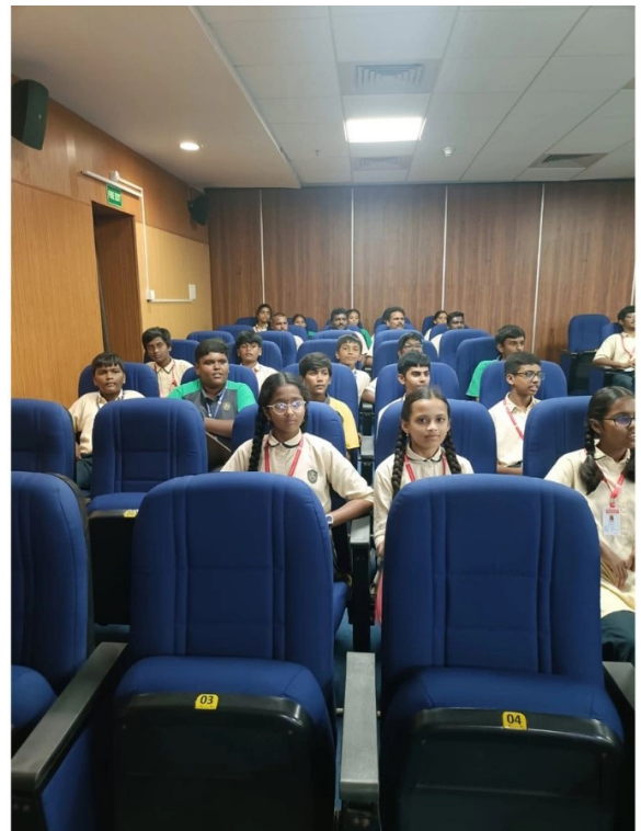
Exploring The Science That Brings Truth To Light!