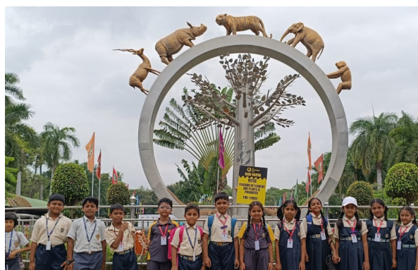
Chugging along -Students at Zoo Park