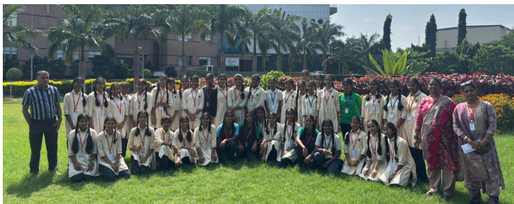
From Classroom Theories to Real-life Applications — A Scientific Adventure!