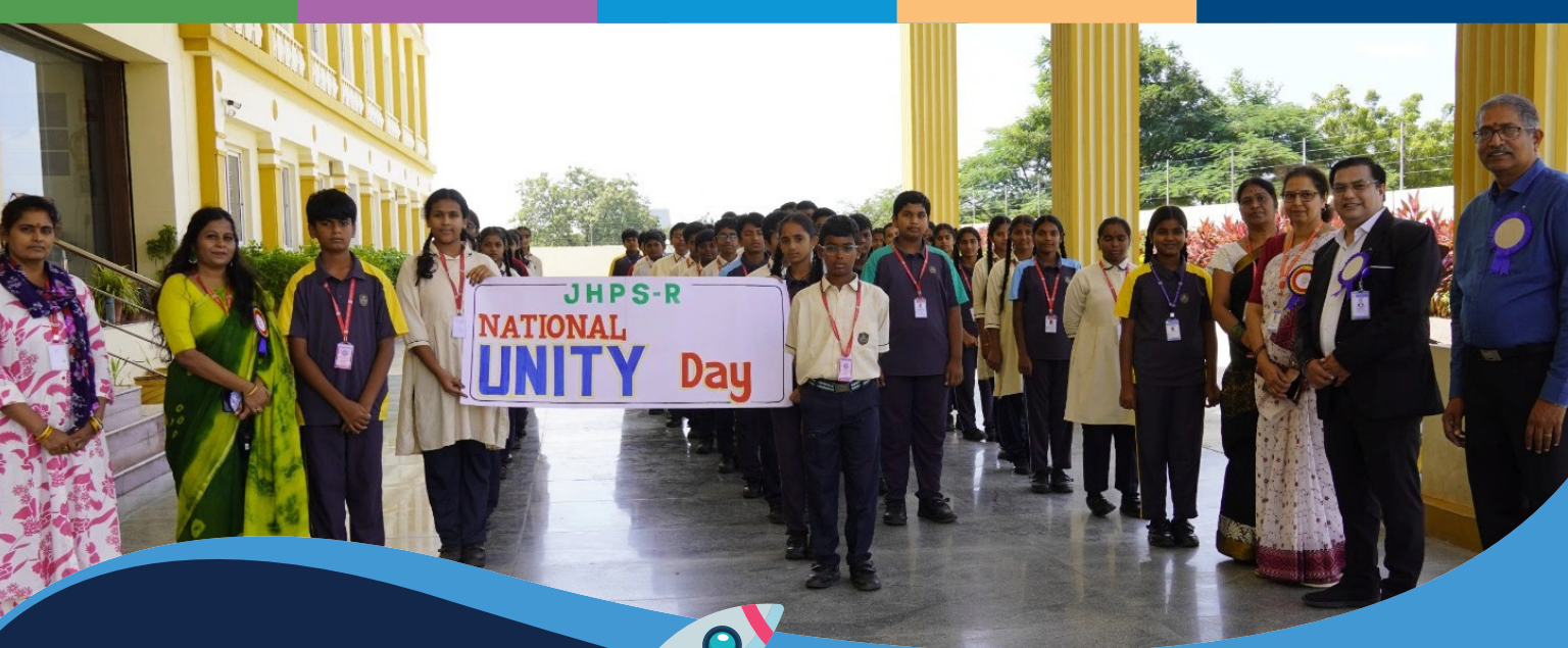
National Unity Day