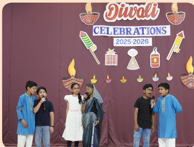
Celebrating The Festival of Lights Together!