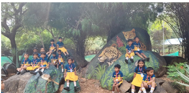
Fun and Laughter at Deer Park!