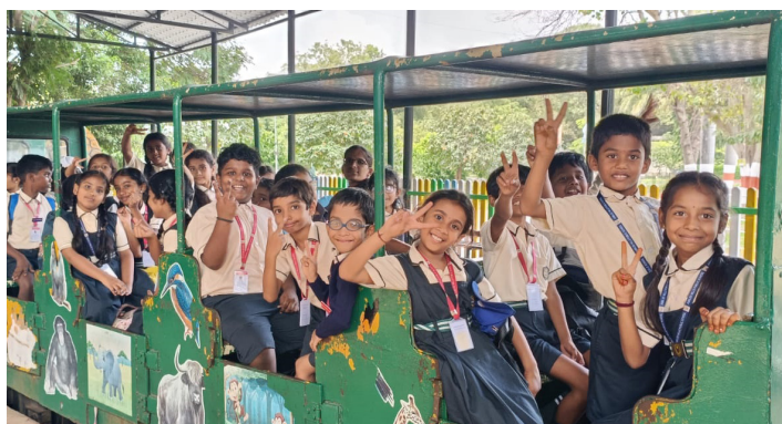
Roaring With Excitement On Our Zoo Adventure!